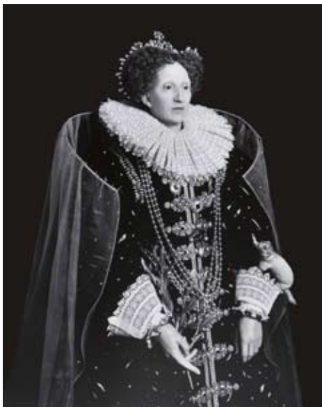
Elizabeth I, 1999