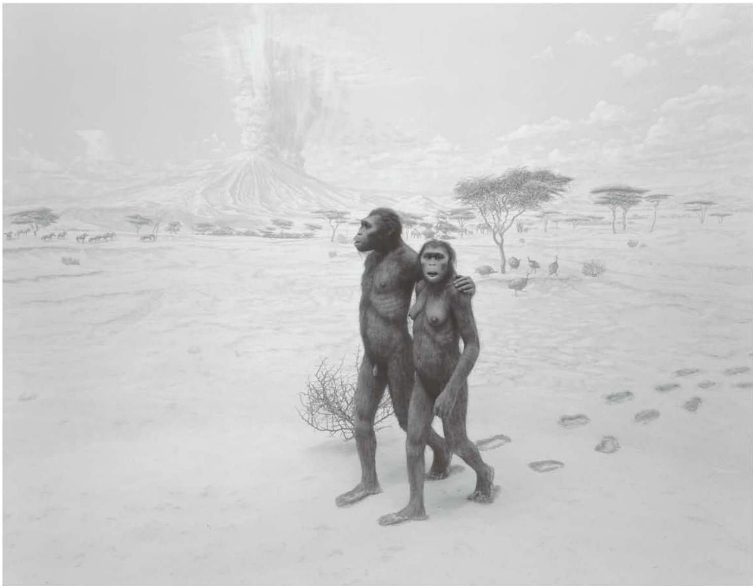
Earliest Human Relatives, 1994