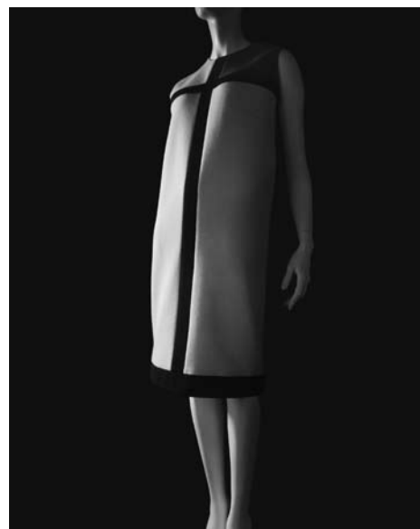
Stylized Sculpture 008, 2007

Yves Saint Laurent 1965, Dress: Collection of the Kyoto Costume Institute