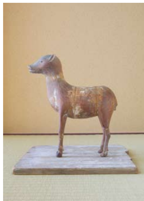
Kasuga Deer Deity, Heian Period

Yves Saint Laurent 1965, Dress: Collection of the Kyoto Costume Institute